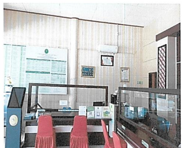
▪ Gambar PTSP pada Pengadilan Negeri Sangatta