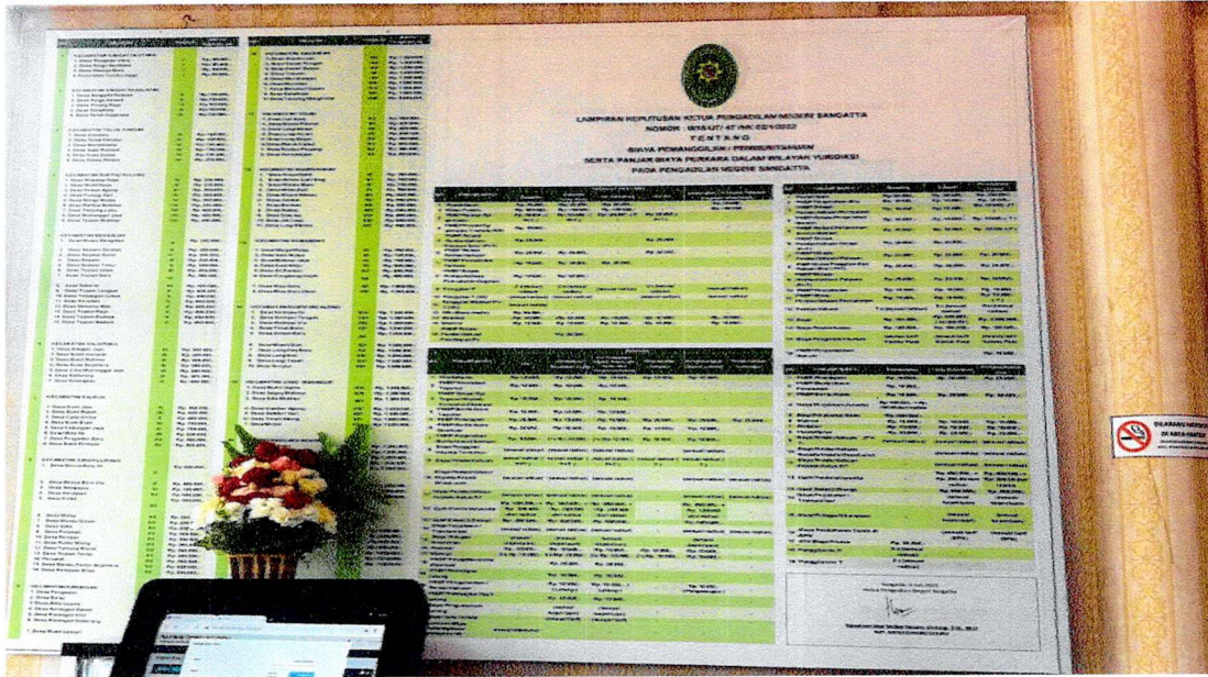
Gambar 3.1 Papan Informasi Biaya Perkara Pengadilan Negeri Sangatta

Tindak lanjut yang dilakukan terhadap ruang lingkup transparansi biaya adalah dengan mengoptimalkan kembali informasi biaya perkara pada Pengadilan Negeri Sangatta kepada masyarakat. Informasi tersebut diletakkan pada spot penting yang seringkali dilalui oleh masyarakat pengguna layanan Pengadilan.